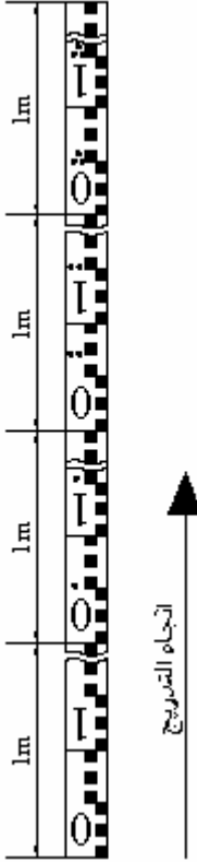
الشكل ١٠,٥ : القامة